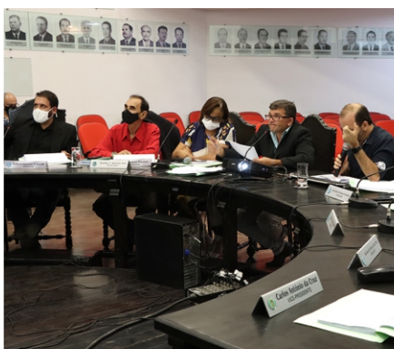
Câmara recebe Executivo para prestação de contas do atual mandato