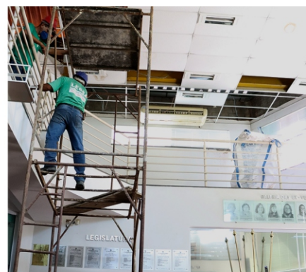
Prédio da Câmara segue em reforma