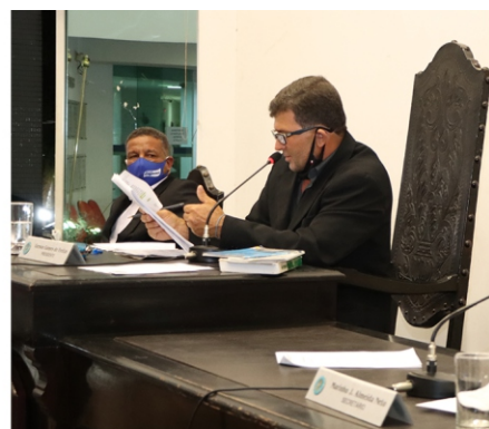
Legislativo aprova PL de reajuste de auxílio alimentação de servidores