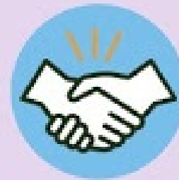
Contato físico com pessoas infectadas