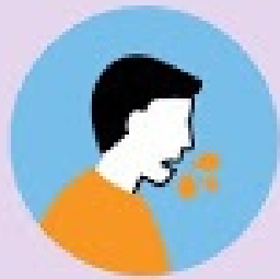
Gotículas de Saliva