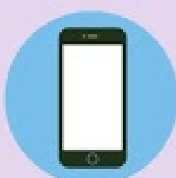
Contato com objetos ou superfícies contaminadas