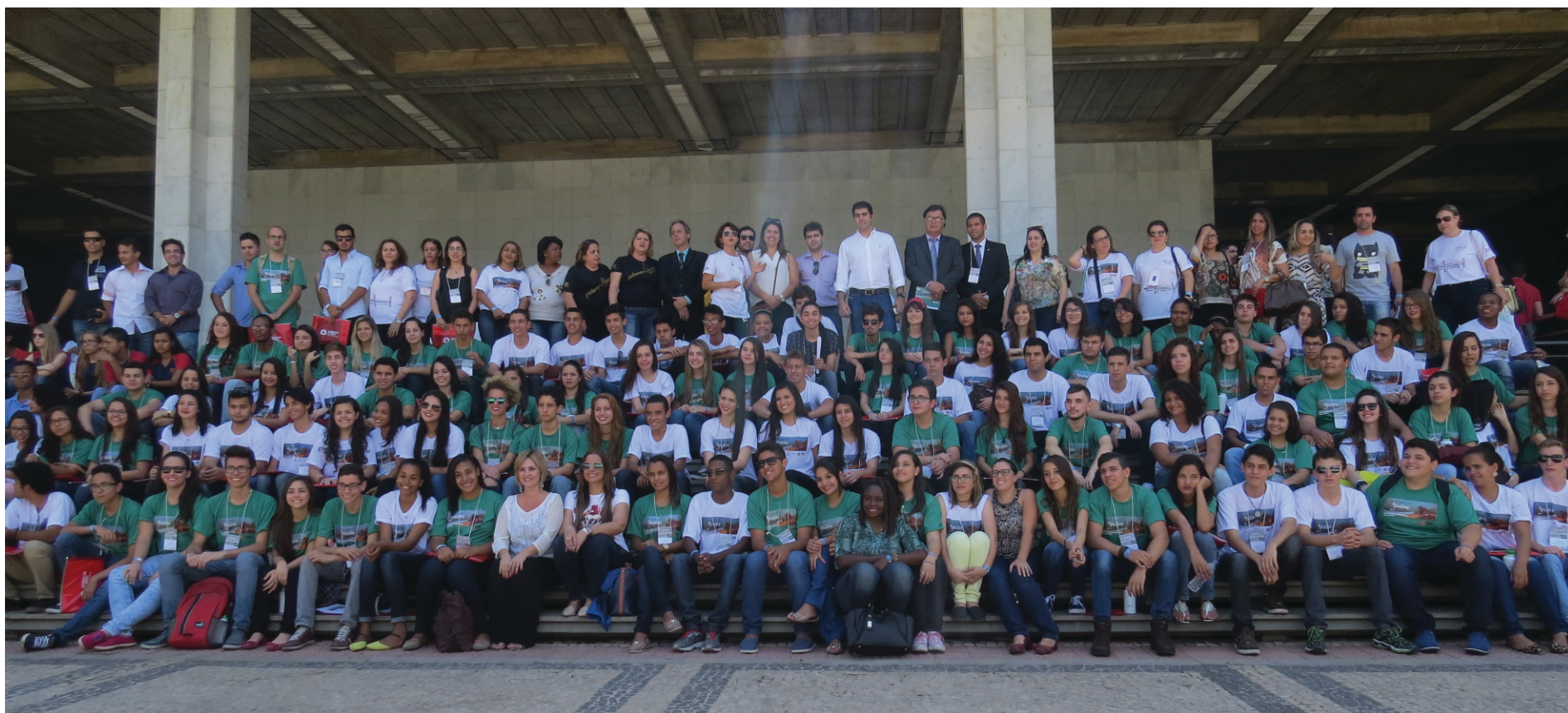
Os 114 estudantes, coordenadores e participantes da Plenária Final durante a foto oficial na Assembleia de Minas em Belo Horizonte

Aconteceu nos dias 21, 22 e 23 de outubro a Plenária Final do Parlamento Jovem 2015. Neste ano, o tema principal foi “Segurança Pública e Direitos Humanos”. Foram envolvidos no trabalho 158 escolas, 1.494 estudantes e 169 monitores. Câmaras municipais de 38 municípios tiveram envolvimento no projeto de educação para a cidadania, desenvolvido pela Assembleia Legislativa em parceria com a PUC Minas. 114 estudantes participam da etapa final no SESC Venda Nova em Belo Horizonte. Nas oficinas preparatórias, empolgação e vontade de contribuir não faltaram.