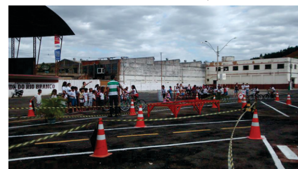
Os estudantes recebendo orientação