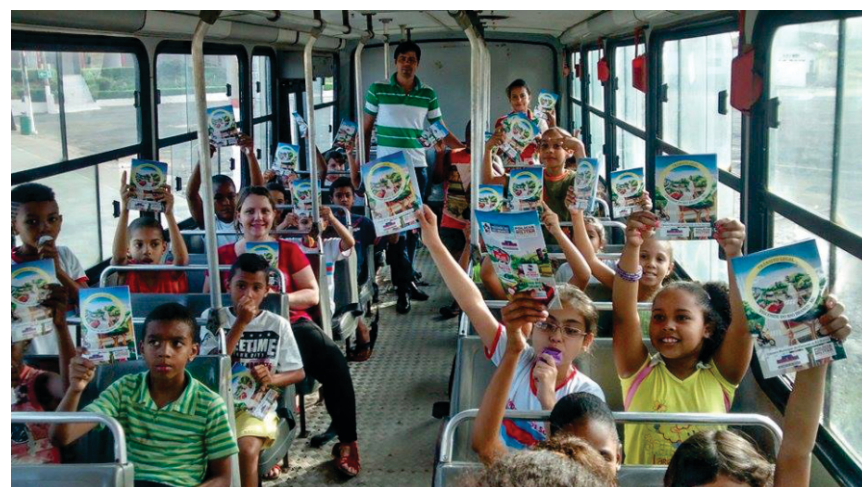
As crianças em direção ao Parque de Exposição