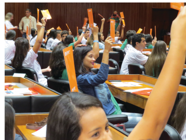
Estudantes em votação na Assembleia

foram discutidos. Já aproximando das 19h, a reunião foi encerrada. Com grande empolgação, os estudantes deram um grito de vitória comemorando o encerramento e esforço de um ano de trabalho.