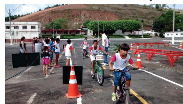
Já na parte prática simulando o trânsito

Participe das reuniões da Câmara Municipal nas três primeiras segundas-feiras de cada mês as 19h