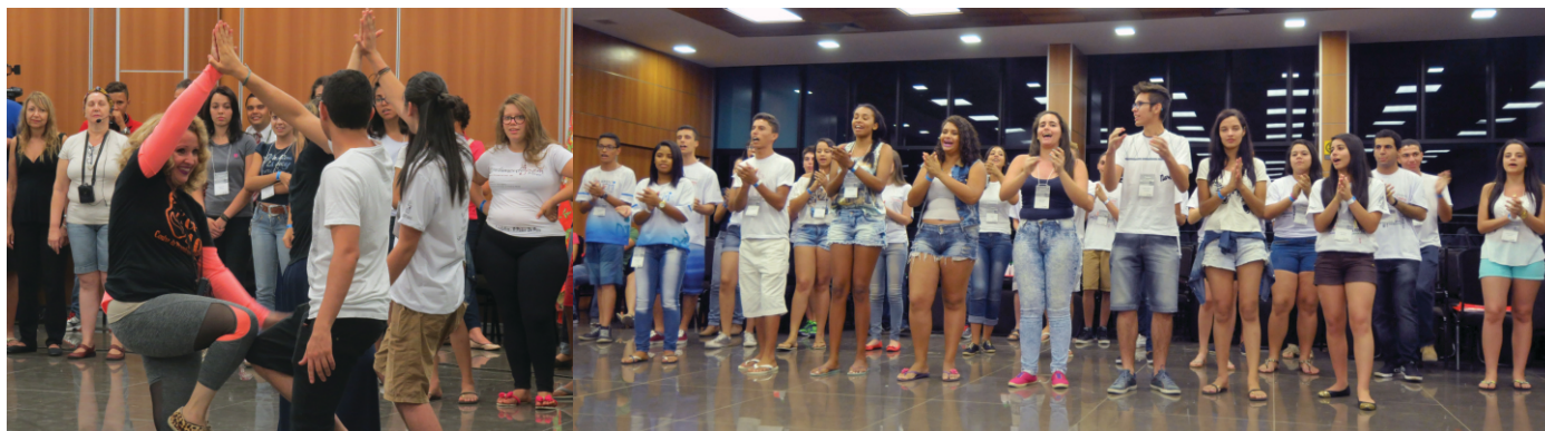
Estudantes realizando dinâmica de grupo durante abertura do evento

Os temas sugeridos pela Coordenação Estadual e pela Área de Consultoria da ALMG para 2016 foram: “Governança Democrática”, “Inclusão Social das Pessoas com Deficiência” e “Mobilidade Urbana”. Com votação apertada, o tema escolhido para 2016 foi “Mobilidade Urbana”. Os temas foram selecionados a partir de propostas feitas pelos municípios. O grupo