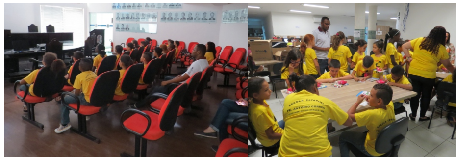
Estudantes durante apresentação do filme Rio 2 e fazendo carteirinhas no CAC

Também foi trabalhado com as crianças e a comunidade atividades sobre a segurança no trânsito.