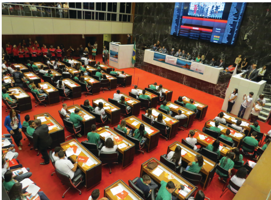
Plenária Final na Assembléia de Minas