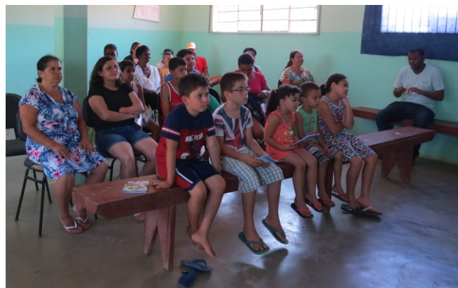
Apresentação do filme Rio 2 no NAC na comunidade Piedade de Cima

A primeira sessão aconteceu no dia 13 de outubro, no NAC – Núcleo de Atendimento ao Cidadão que funciona na comunidade da Piedade de Cima para crianças e moradores em geral. O filme exibido foi o Rio 2.