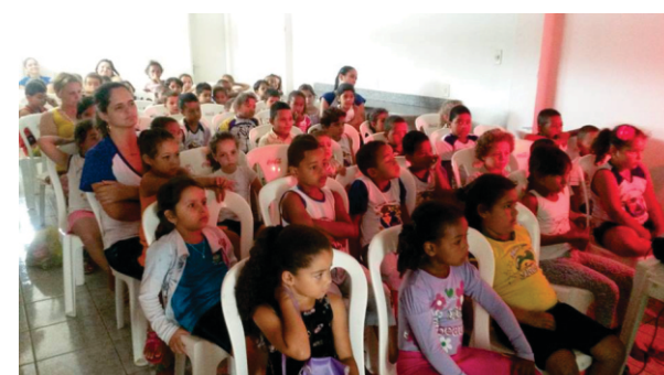
Estudantes atentos durante a parte teórica

Para facilitar o trabalho teórico, foi montado e distribuído uma cartilha contendo várias instruções de segurança, direitos e deveres no trânsito, tudo de forma bem ilustrada e de fácil entendimento.