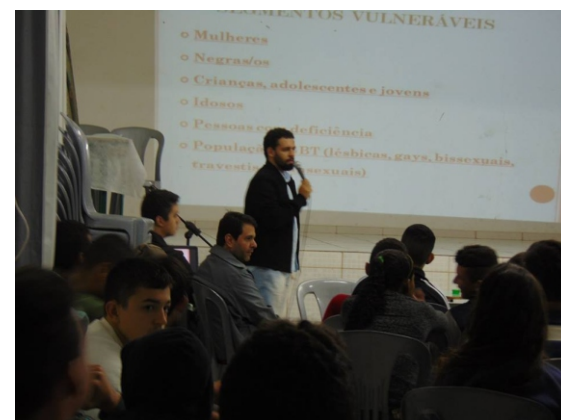
Palestra sobre segmetos vulneráveis

Participaram das palestras e debates alunos dos 1, 2 e 3º. a do Ensino Médio. A equipe do Parlamento continua os trabalhos com os alunos conversando em grupos temáticos e falando sobre Prevenção Social do Crime, Novas perspectivas para a atuação policial e Proteção a segmentos vulneráveis à violência. As próximas etapas são Plenária Municipal, Regional e Estadual.