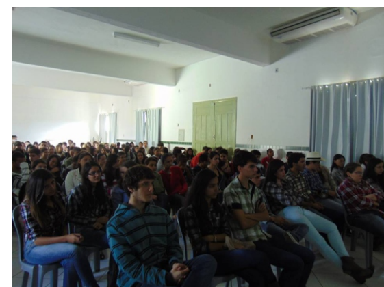
Cerca de 300 alunos participaram da palestra e debate