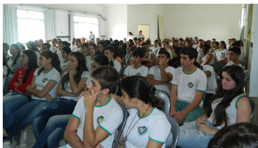
Estudantes durante a palestra no Colégio Municipal Rio Branco