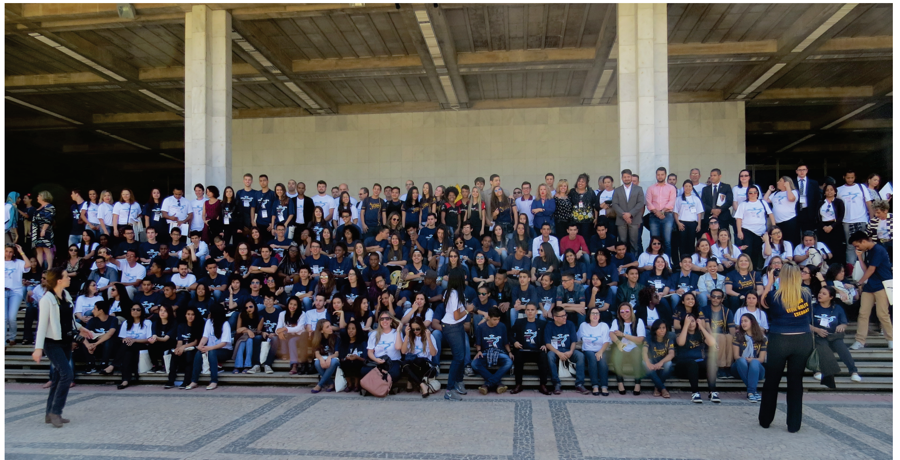
Preparação para foto oficial do Parlamento Jovem de Minas - Plenária Estadual da Edição 2016 Espaço Democrático José Aparecido de Oliveira - Hall das Bandeiras - Palácio da Inconfidência - ALMG

A Plenária aconteceu em 3 dias. Nos dois primeiros dias houve a preparação e discussão das propostas na Escola do Legislativo. No