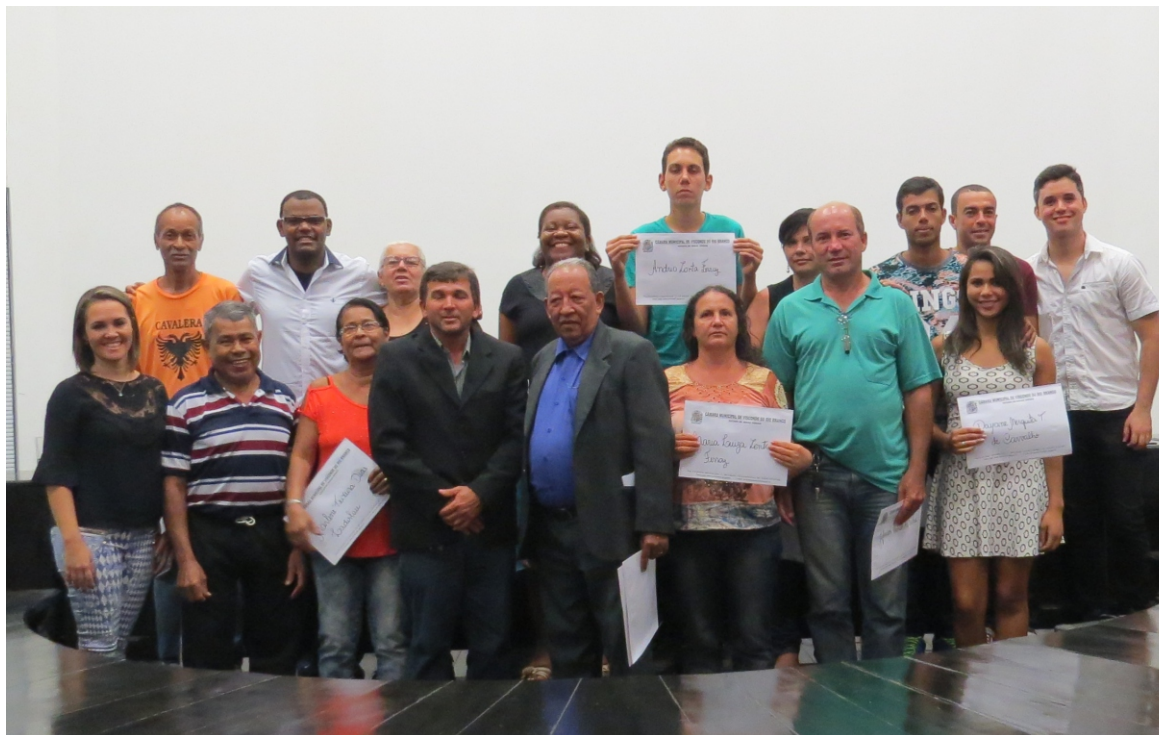
Os formandos com vereadores que prestigiaram a homenagem e alguns servidores da Câmara