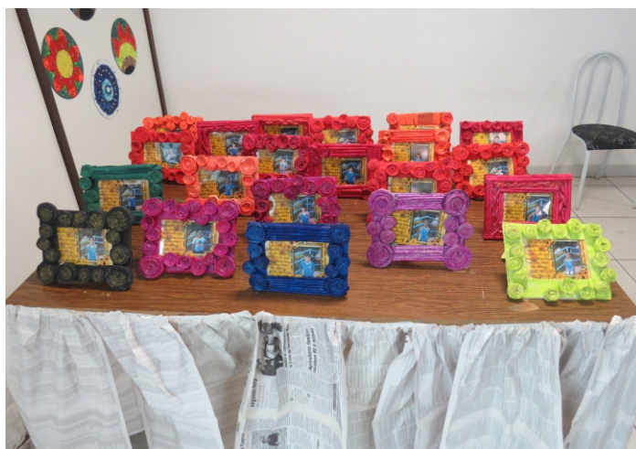
No fundo, mandalas feitas com disco de vinil e sob a mesa, portas retratos feitos com papelão e papel jornal

Recentemente, a escola foi convidada para divulgar seus trabalhos no projeto Raízes Culturais, promovido pela Secretária Municipal de Cultura e organizado pelo colunista do jornal Voz do Rio Branco e membro da Academia Rio-branquense de Letras Marcelo Pinto, onde artistas populares têm