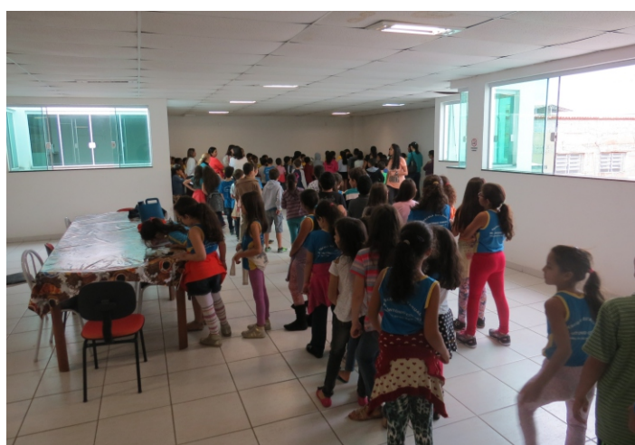
Estudantes de diversas escolas estiveram prestigiando os trabalhos