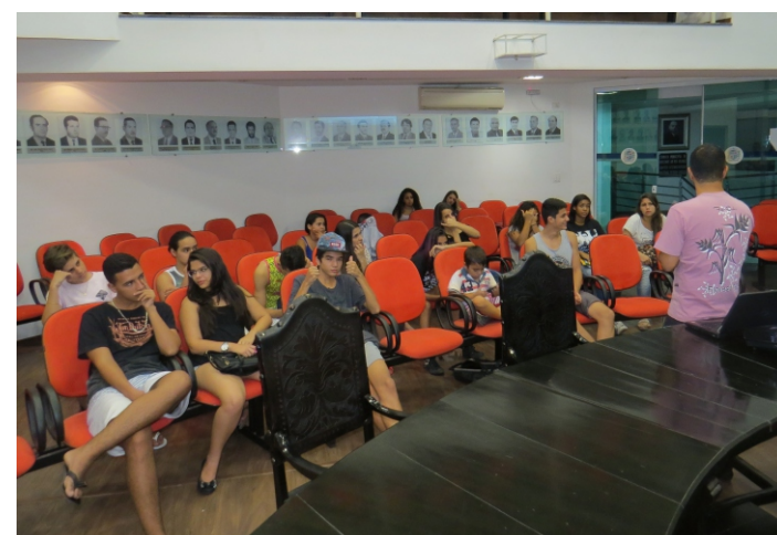
Momento de debate entre os estudantes

encontradas com as pessoas pensando no conjunto, com ações voltadas para o senso comum, pensar em todos.