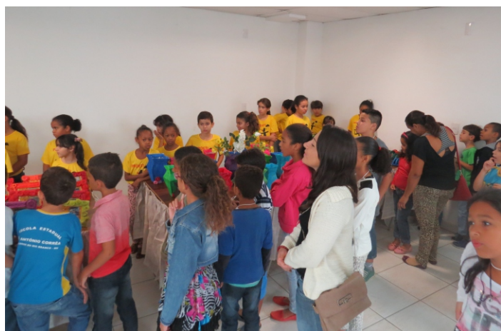
Os visitantes atentos às explicações sobre as artes confeccionadas

No horário da manhã, os alunos participam das aulas normais. Após o almoço, eles têm oficinas de Artesanato Popular, Esporte e Lazer, Jornal Escolar, Inglês e Educação em Direitos Humanos.