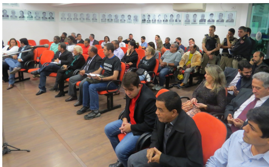
Público presente pouco antes do início da audiência

Esta audiência foi pedida ao presidente da casa por conta de uma série de eventos que ocorreram no município nos últimos meses, dentre eles, 2 homicídios com um duplo. Preocupados, a população reivindicou, de forma direta e através das redes sociais, uma resposta sobre estes acontecimentos e que ações deverão ser tomadas. Para buscar melhores soluções para a sociedade, as autoridades dialogaram e debateram sobre diversos assuntos dentro deste contexto como a falta de