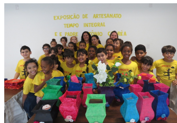
Os pequenos com vasos para flores feitos com papelão e tinta guache

O projeto é patrocinado pelo governo do estado e teve seu início na escola no ano de 2012. As atividades neste ano iniciaram em 01 de março. Esta ação e outras que estão programadas fazem parte das comemorações pelos 70 anos da Escola.