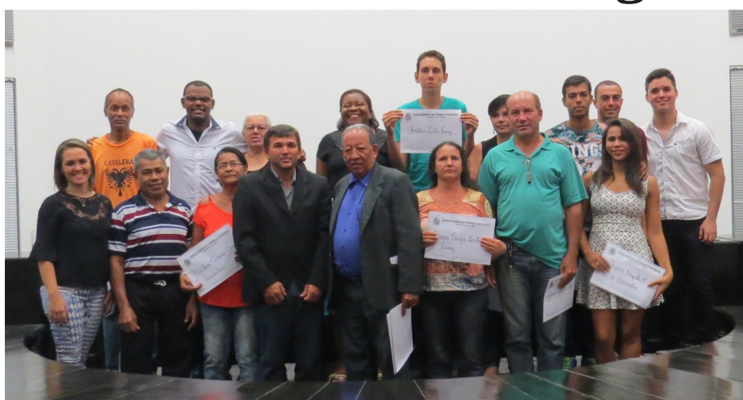
Homenageados com vereadores e funcionários da Câmara

A Câmara realizou no dia 11 de maio, a Cerimônia de Encerramento e Entrega dos Certificados da Primeira Turma do Curso de Inclusão Digital promovida pela Escola do Legislativo Antônio Pedro Nolasco da Câmara Municipal de Visconde do Rio Branco.