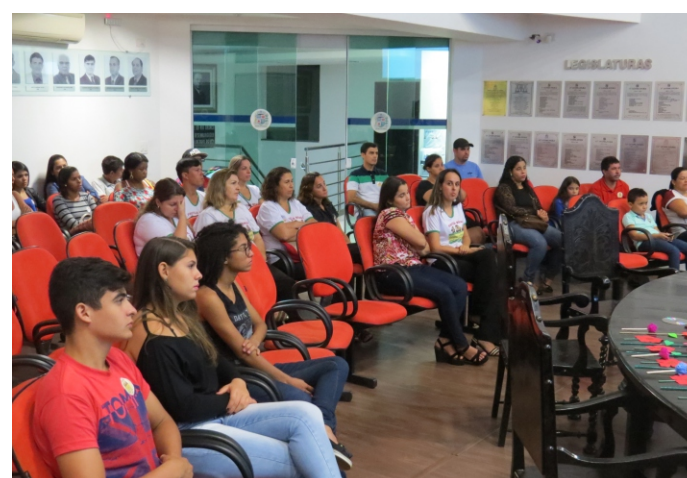
Parte do público presente