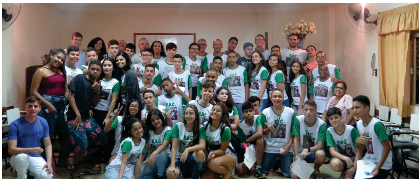
Alunos do EAC participaram de uma dinâmica promovida pelo coordenador do Parlamento Jovem de Visconde do Rio Branco