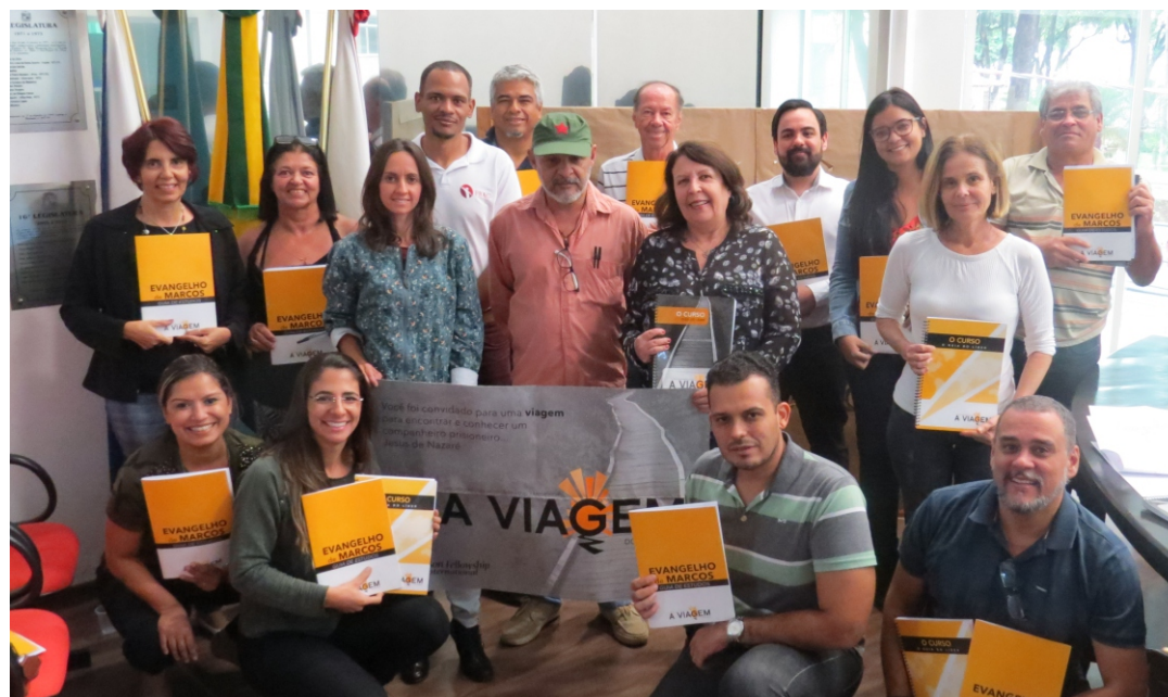
Curso na Câmara Municipal realizado em 24 de maio de 2018

Porque o método Apac é inovador: todos os recuperandos são chamados pelo nome, valorizando o indivíduo; individualização da pena; a comunidade local participa efetivamente, através do voluntariado; é