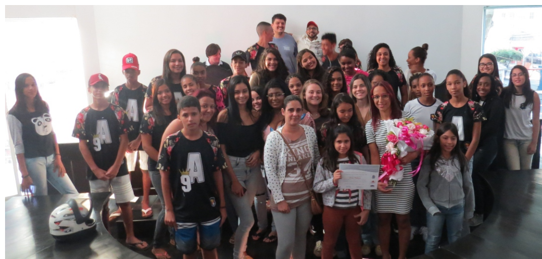
Carine com parte do público presente

eu fui vítima. Sou uma mulher como outra e minha dor só me faz querer evitar a dor de outras."